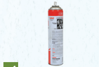
✓ nge'esi kapa fana faito'o (aerosols)

Ko e ngaahi veve eni 'e 'ikai tali ke fa'o mai he pini 'o e veve ke toe faka'aonga'i