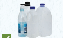
✓ nge'esi hina pelesitiki

Ko e ngaahi veve eni 'oku lava ke toe faka'aonga'i pea ngofua ke fa'o he pini