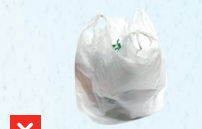
✗ tangai pelesitiki (fonu pē maha)