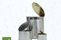
✓ nge'esi kapa ukamea