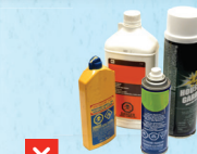
✗ kemikale pē ko ha fa'ahinga koloa fakatu'utāmaki